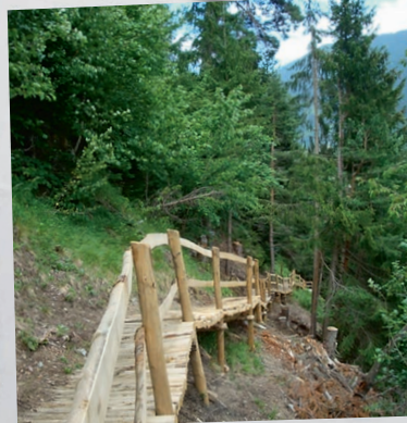
Der Jakobsweg zwischen Cumpadials und Madernal ist wiederhergestellt.

Unter dem Motto «Im Abseits den Himmel suchen» kann gemeinsam die Strecke von Breil/Brigels nach Sumvitg-Cumpadials gepilgert werden. Treffpunkt: 8.59 Uhr in Breil/Brigels, casa commu- nala. Rückreise ab Sumvitg um 16.52 Uhr. Eine Anmeldung unter www.gr.kath.ch ist hilfreich, aber nicht notwendig.