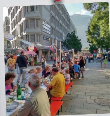
Kommen Sie zum zweiten Foodsave-Bankett in Chur – am 16. Sept. auf dem Theaterplatz.

... am Sonntag, 11. und 25. Sep- tember , um 19 Uhr Adoray in der St. Luzikirche Chur stattfindet?