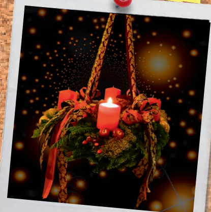
28. November: 1. Advent